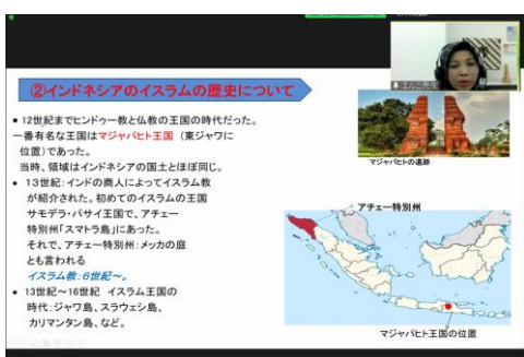
▲インドネシアについての講義