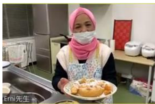
▲オンライン料理教室