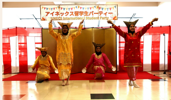
📷 インドネシアの留学生によるパフォーマンス