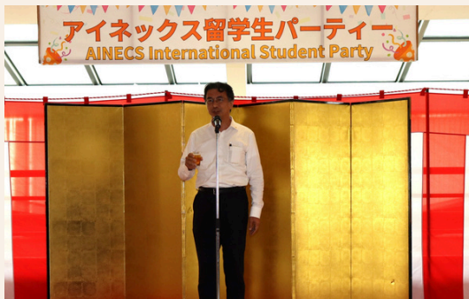
📷 上甲様による乾杯のご発声

AINECSでは、引き続き外国人留学生の支援を通して、地域と世界を結ぶ活動を推進してまいります。