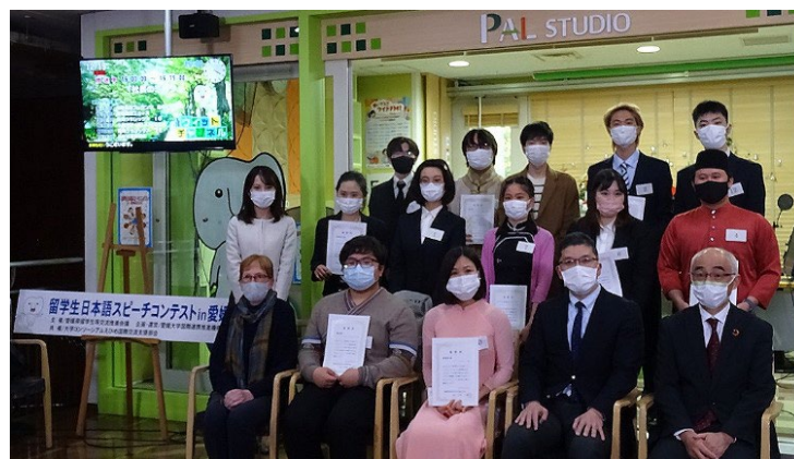
審査員と出場者全員で記念撮影