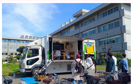
📷 起震車体験の様子

第2回目は、松山東警察署の方にお越しいただき、交通規則および防犯講話や落とし物の手続きについてご説明いただきました。続いて、松山市総合政策部防災・危機管理課の方のご協力のもと、119番の利用方法等や地震時の身の守り方について講話をいただきました。あわせて、水消火器訓練や煙体験、起震車体験も実施しました。